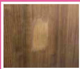
充填剤を塗り、 キレイに均します。