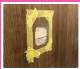
裏から固定し、 穴周りをキレイにします。